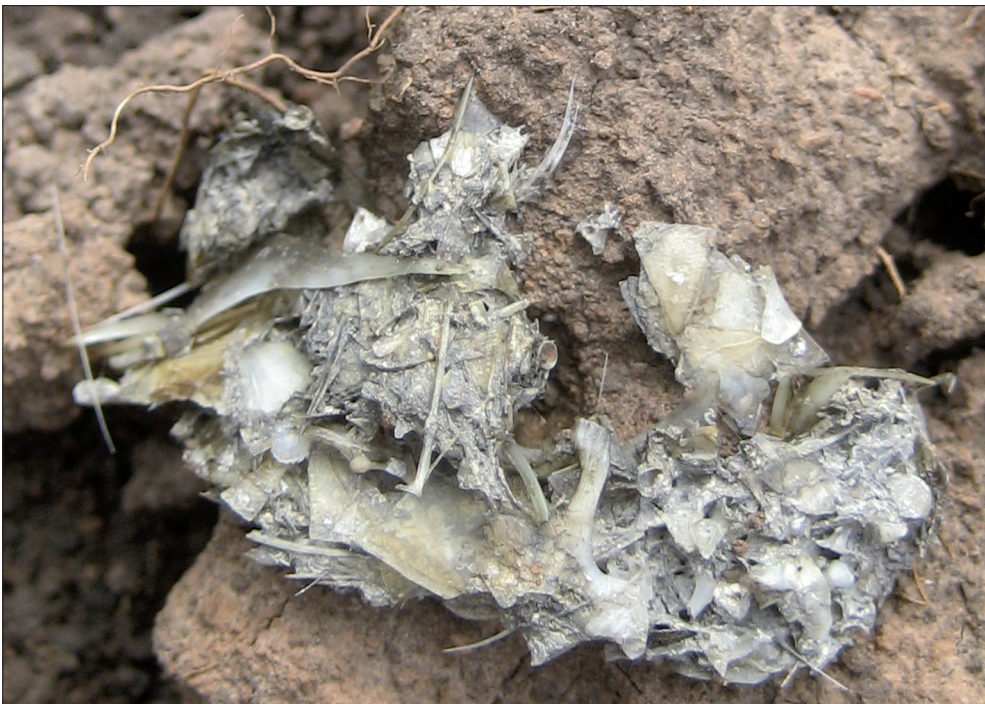
Abb. 2: Losung eines Fischotters, Wechsel zwischen Pleiße und „Nobitzer Teich“, 29.3.2009.