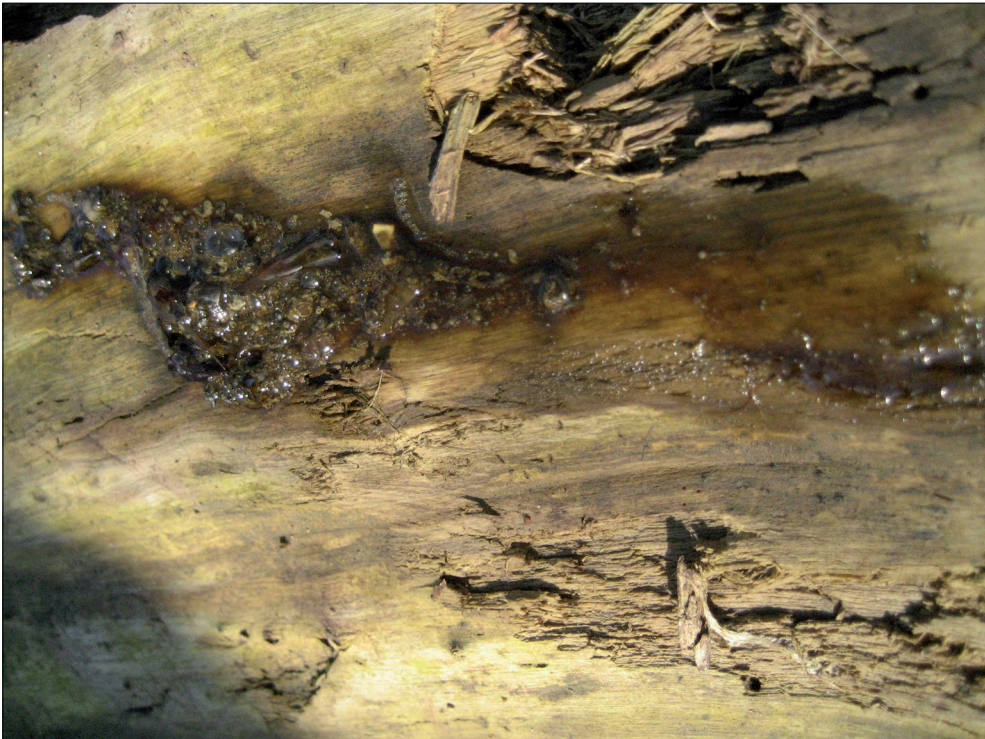
Abb. 3: Analsekret eines Fischotters, Pleißeufer am Wehr bei Treben, 10.3.2008.