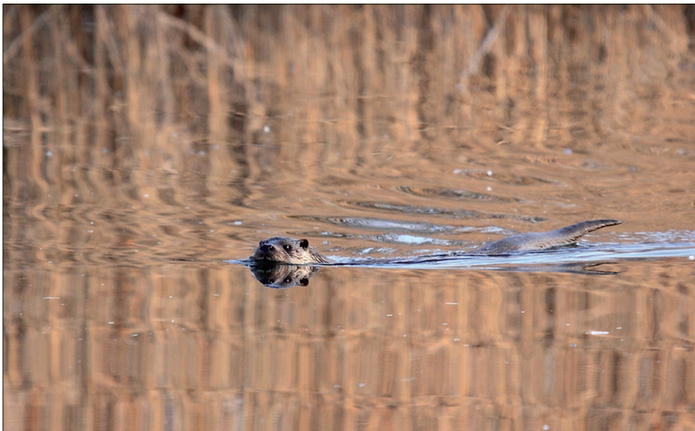
Abb. 6: Fischotter in den Haselbacher Teichen („See“), 6.3.2012 um 7.40 Uhr.