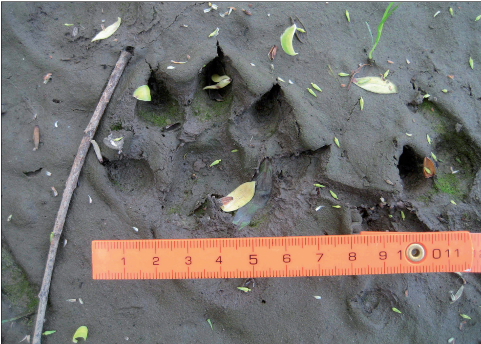
Abb. 1: Trittsiegel eines Fischotters, Gerstenbachufer bei Serbitz, 24.4.2009.