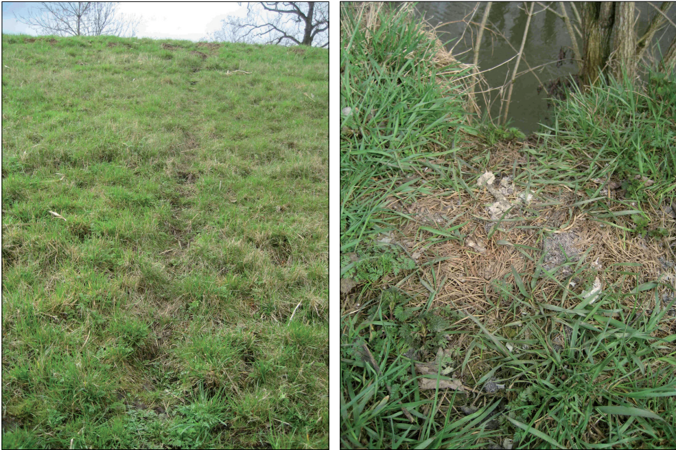
Abb. 7: Wechsel zwischen Pleiße und Haselbacher Teichen, Pfad auf dem Damm zum „Nobitzer Teich“ (links) und Losung am Ein-/Ausstieg zum Graben am Damm zum „Nobitzer Teich“ (rechts), 29.3.2009.