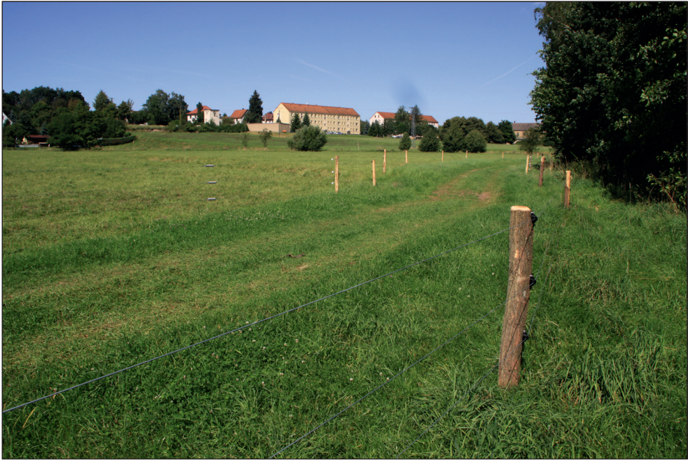
Abb. 5: Der wiedereröffnete Wiesenweg für Radfahrer und Spaziergänger ist mit Infotafeln ausgestattet und wird durch den Pächter gemäht.