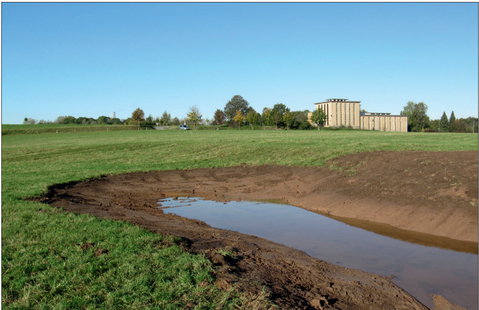
Abb. 3: Im Herbst 2009 neu angelegtes Laichgewässer zur Sicherung der Bestände der seltenen und wieder eingewanderten Amphibienarten wie Wechselkröte und Laub- und Moorfrosch.