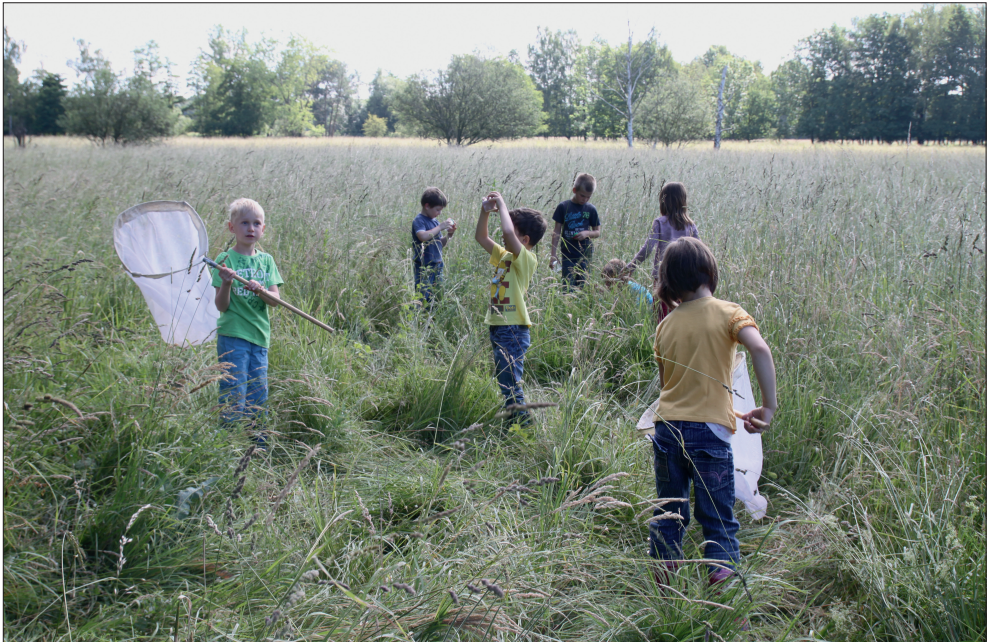
Abb. 2: Schwerpunkte in der Öffentlichkeitsarbeit waren Angebote für Kinder und Jugendliche, hier eine Wiesenexkursion mit Kindern des Kindergartens Windischleuba.