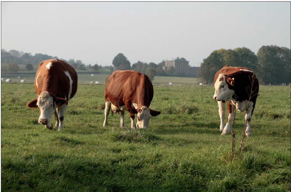
Abb. 6: Extensive Beweidung der Pleißewiesen mit Simmentaler Fleckvieh nach dem im Rahmen des Projektes erarbeiteten Nutzungskonzept.