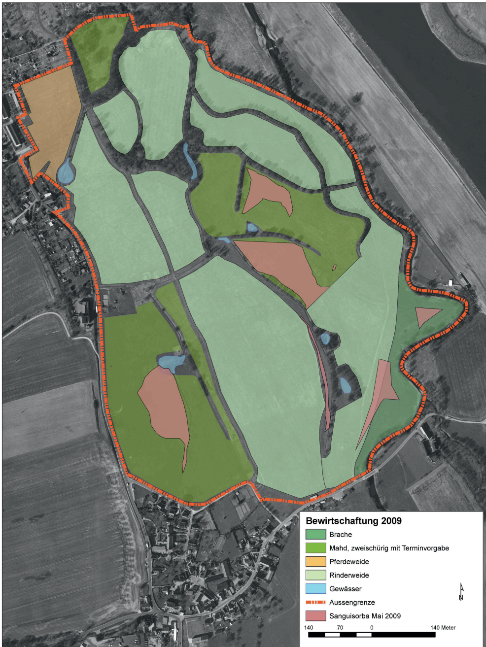
Abb. 4: Mit dem Pächter erarbeitetes Nutzungskonzept zur extensiven Bewirtschaftung der Pleißwiesen zwischen Windischleuba und Remsa (Quelle: Mauritianum Altenburg).