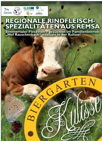
Abb. 7: Vermarktung des Fleisches der Pleißbeauenrinder über zwei Gaststätten mit Projekterläuterung in der Speisekarte (Foto: Mauritianum Altenburg).