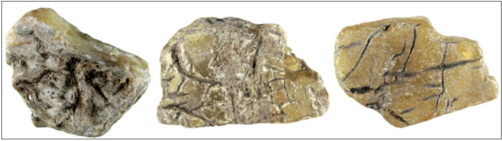
Abb. 7: Drei Proben von Goitschit (ca. 30–40 mm) aus der Sammlung R. Fuhrmann, die in FUHRMANN (2010) abgebildet wurden.