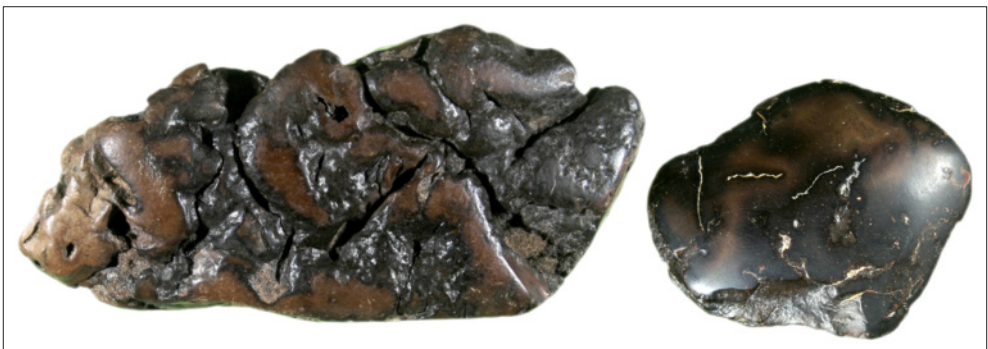
Abb. 9: Zwei „Braunerharze“ aus der Veröffentlichung FUHRMANN (2010): Links „NN9“ von Tafel 8 Bild 7 (76 mm) und rechts „NN9“ von Tafel 8 Bild 3 (45 mm). Hierbei dürfte es sich, auch den nach FUHRMANN (2010) in Abb. 18 gezeigten Spektren, um Beckerite handeln.