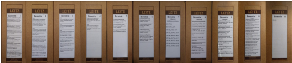
Abb. 2: In 11 Archivboxen sind Sonderdrucke, Kopien von Veröffentlichungen zum Thema Bernstein, Kopien von Erkundungsberichten, Schichtenverzeichnisse von Erkundungsbohrungen, Fotodokumentationen und der Schriftwechsel zum Thema Bernstein im Zeitraum 1974 bis 1989 enthalten.