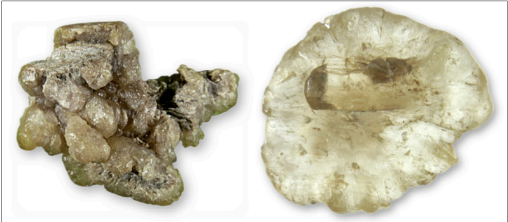
Abb. 8: Zwei „Beckerite“ aus der Veröffentlichung FUHRMANN (2010): Links von Tafel 5 Bild 9 (27 mm) und rechts von Abb. 12 (24 mm). Hierbei handelt es sich nach Anschauung wahrscheinlich um Sieburgite. Das bei FUHRMANN (2010) in Abb. 11 gezeigte IR-Spektrum für seinen „Beckerit“ zeigt deutliche Absorptionsbanden bei 750 und 690 \text{cm}^{-1} , die von R. Fuhrmann selbst aromatischen Ringsystemen zugeordnet wurden – ein deutlicher Hinweis auf Sieburgit.