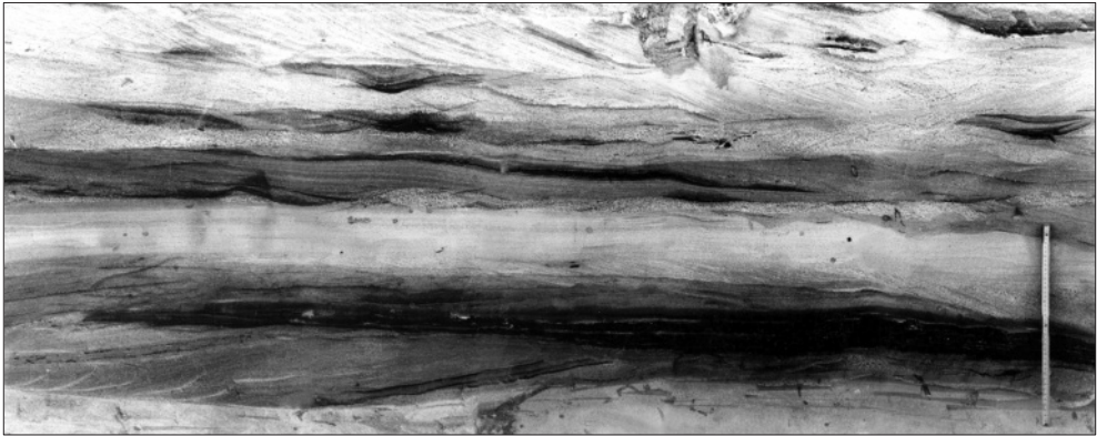
Abb. 3: Aufschlussfoto vom Zöckeritzer Bernsteinhorizont: Bernsteinführende kohlige Lagen in Sanden. (Foto: R. Fuhrmann, 1975, nördlich der ehemaligen Ortslage Niemegek)

Herausragender Bestandteil der Bernsteinsammlung R. Fuhrmann sind die 1189 Stück akzessorischer Harze aus der Bitterfelder Bernsteinlagerstätte. Teilweise handelt es sich dabei um die Originale zu den Veröffentlichungen über die Bitterfelder Bernsteinarten (FUHRMANN & BORSDORF 1986, FUHRMANN 2010):